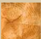
Fibre de bois