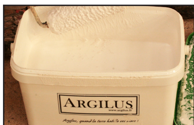
Bac sous-couche d'accroche Argilus