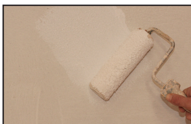
Étape 1 - application au rouleau de la sous-couche d'accroche Argilus.