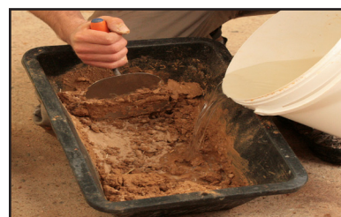
Étape 2 - préparation et humidification de l'enduit (spatule ou malaxeur)