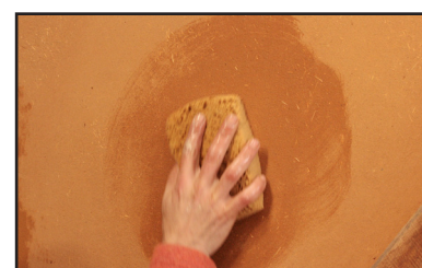
Étape 5 - une fois l'enduit sec, passage d'une éponge ou d'une taloche éponge semi-humide afin de gommer les défauts d'application et faire ressortir toutes les fibres de lin.