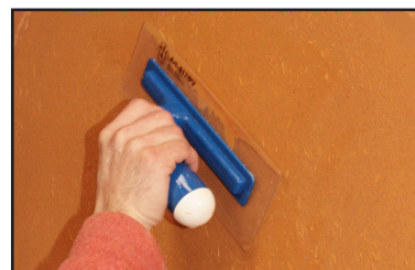
Étape 4 - à mi séchage, resserrer l'enduit à l'aide d'une spatule plastique souple.