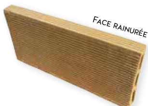
ALVÉOLES 3 TROUS